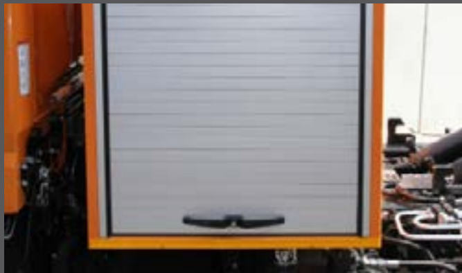
Systemschrank hinter dem Fahrerhaus