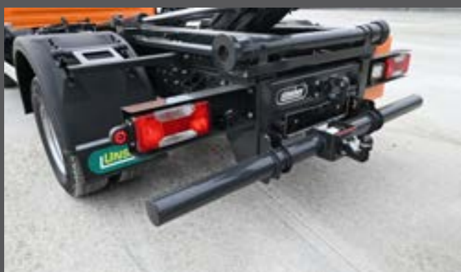
Heckunterfahrerschutz mit Kugelkopfkupplung