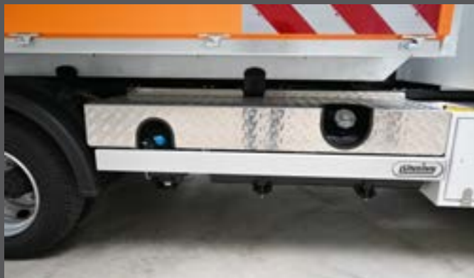
Schutzabdeckung über dem Tank