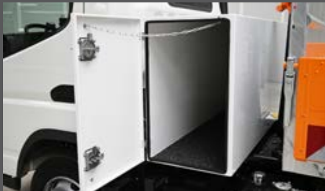
Systemschrank hinter dem Fahrerhaus