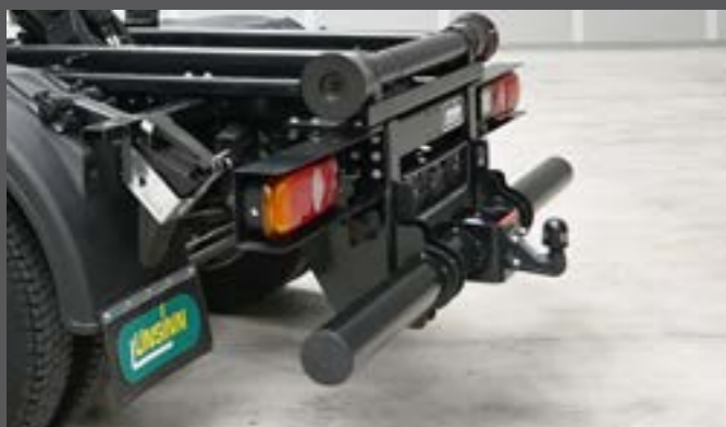
Heckunterfahrerschutz mit Kugelkopfkupplung