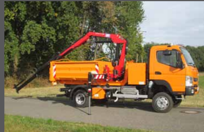
Fuso 6C18 4x4 - Kommunalaufbauten