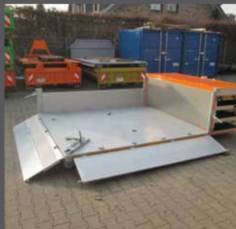
Pritsche mit Systemschrank