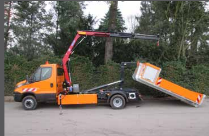
Iveco Daily - Kommunalaufbauten