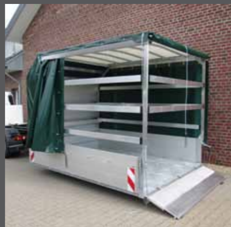
Pritsche mit Plane und Spriegel