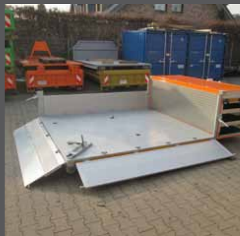
Pritsche mit Systemschrank