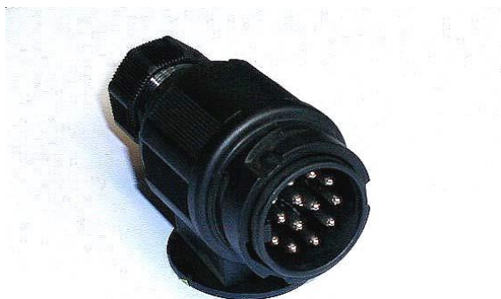
Typ: 13-polig nach ISO