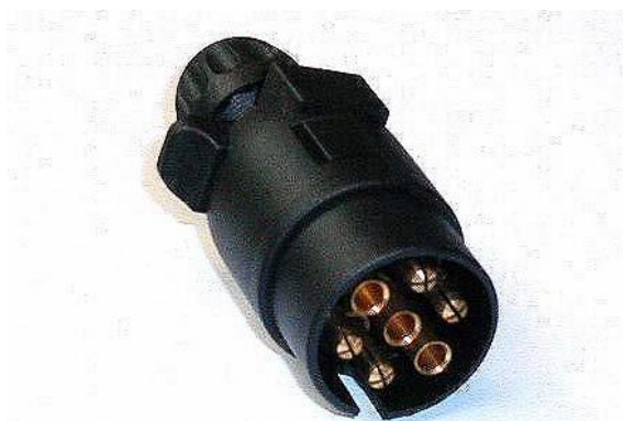
Typ: 7-polig nach ISO